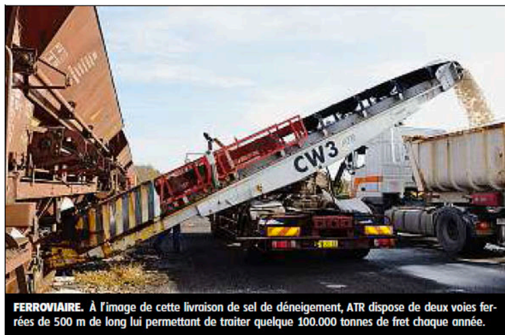
FERROVIAIRE. À l'image de cette livraison de sel de déneigement, ATR dispose de deux voies ferrées de 500 m de long lui permettant de traiter quelque 100.000 tonnes de fret chaque année.