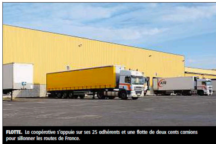
FLOTTE. La coopérative s'appuie sur ses 25 adhérents et une flotte de deux cents camions pour sillonner les routes de France.